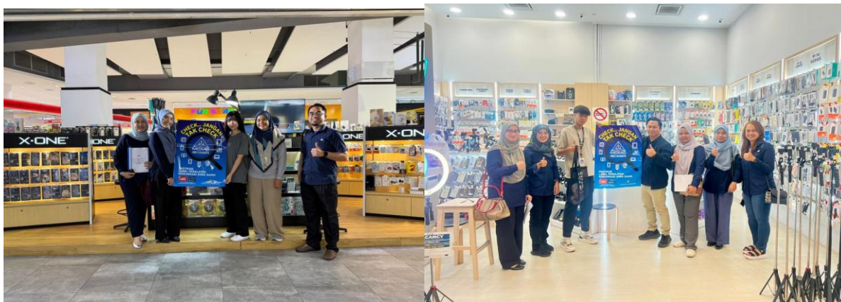
Aktiviti Direct Engagement di premis.